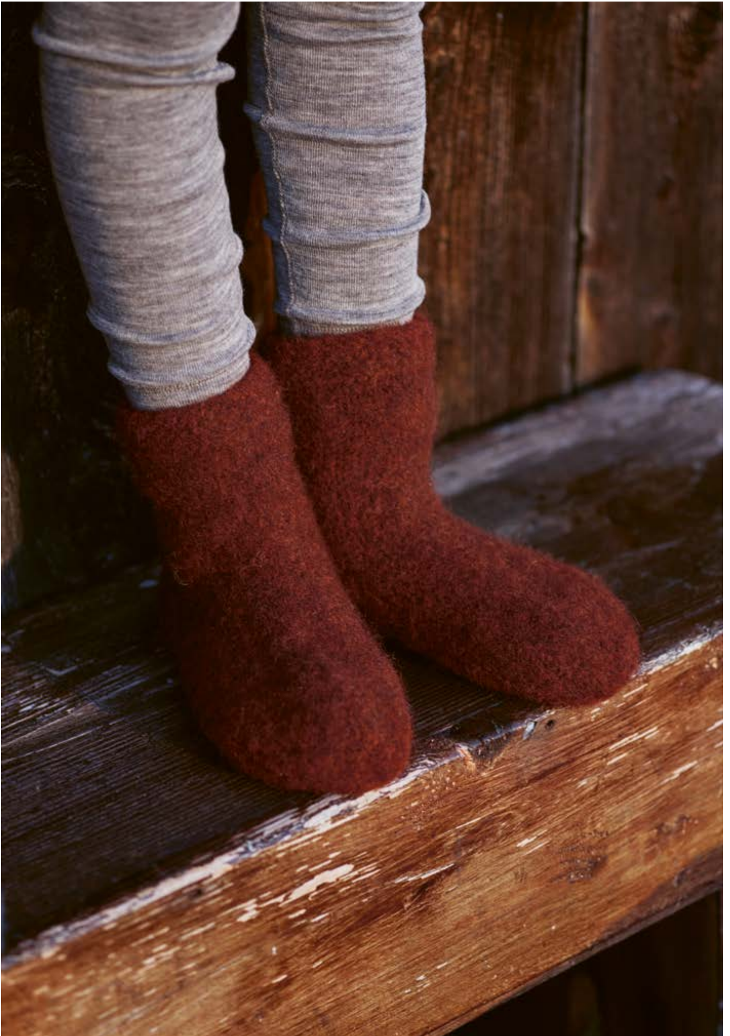
289-2 Tova sokker i Vams 3 - 14 år - dame - herre