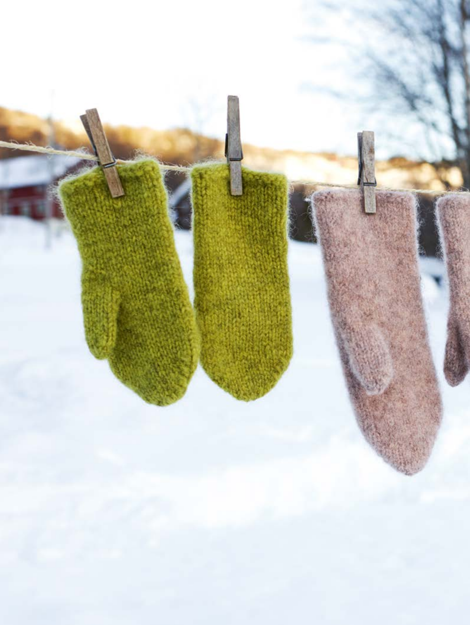
289-3 Tova votter i Vams 3 - 14 år - dame - herre