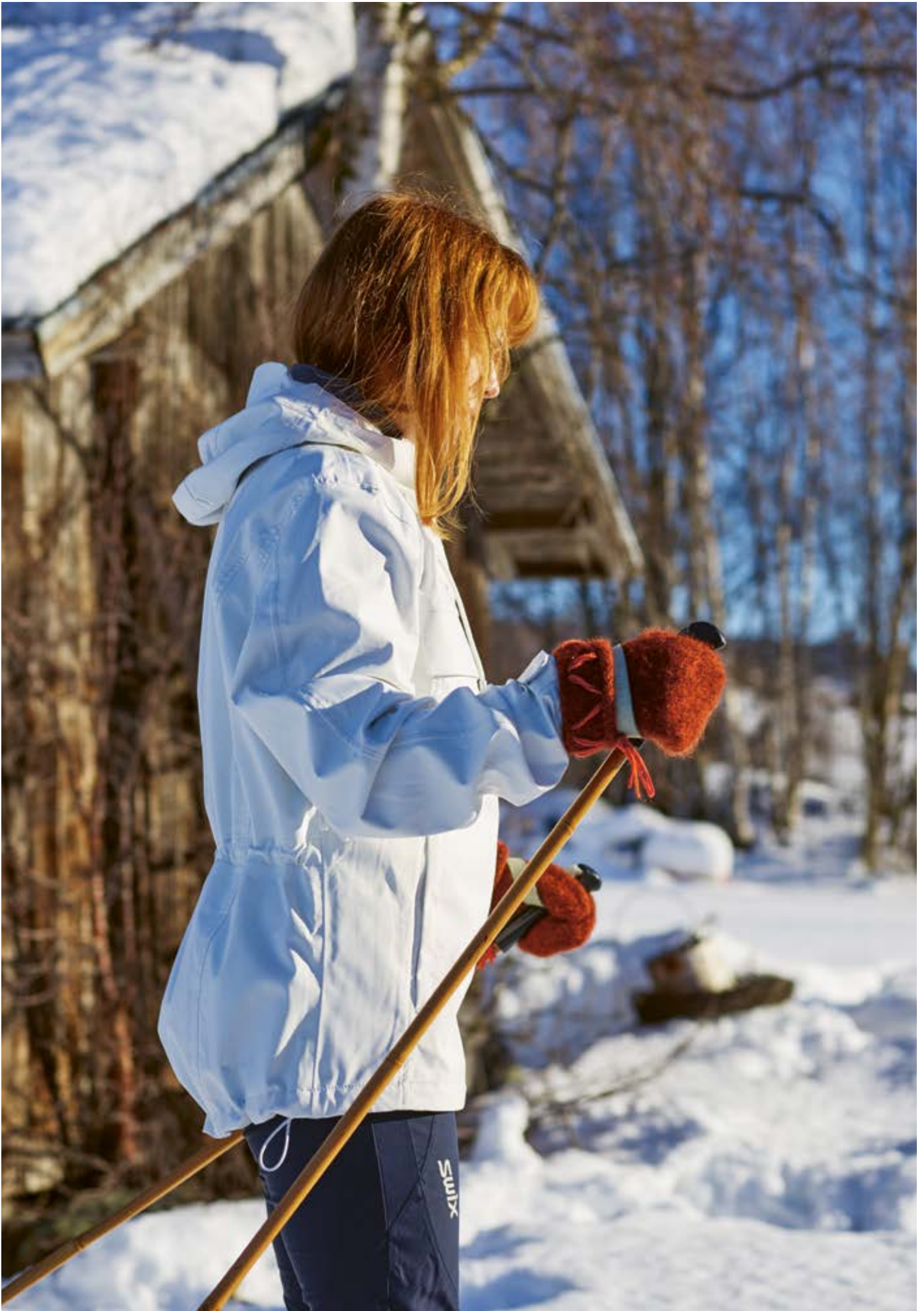
289-1 Lovikkavotter i Vams 3 - 14 år - dame - herre