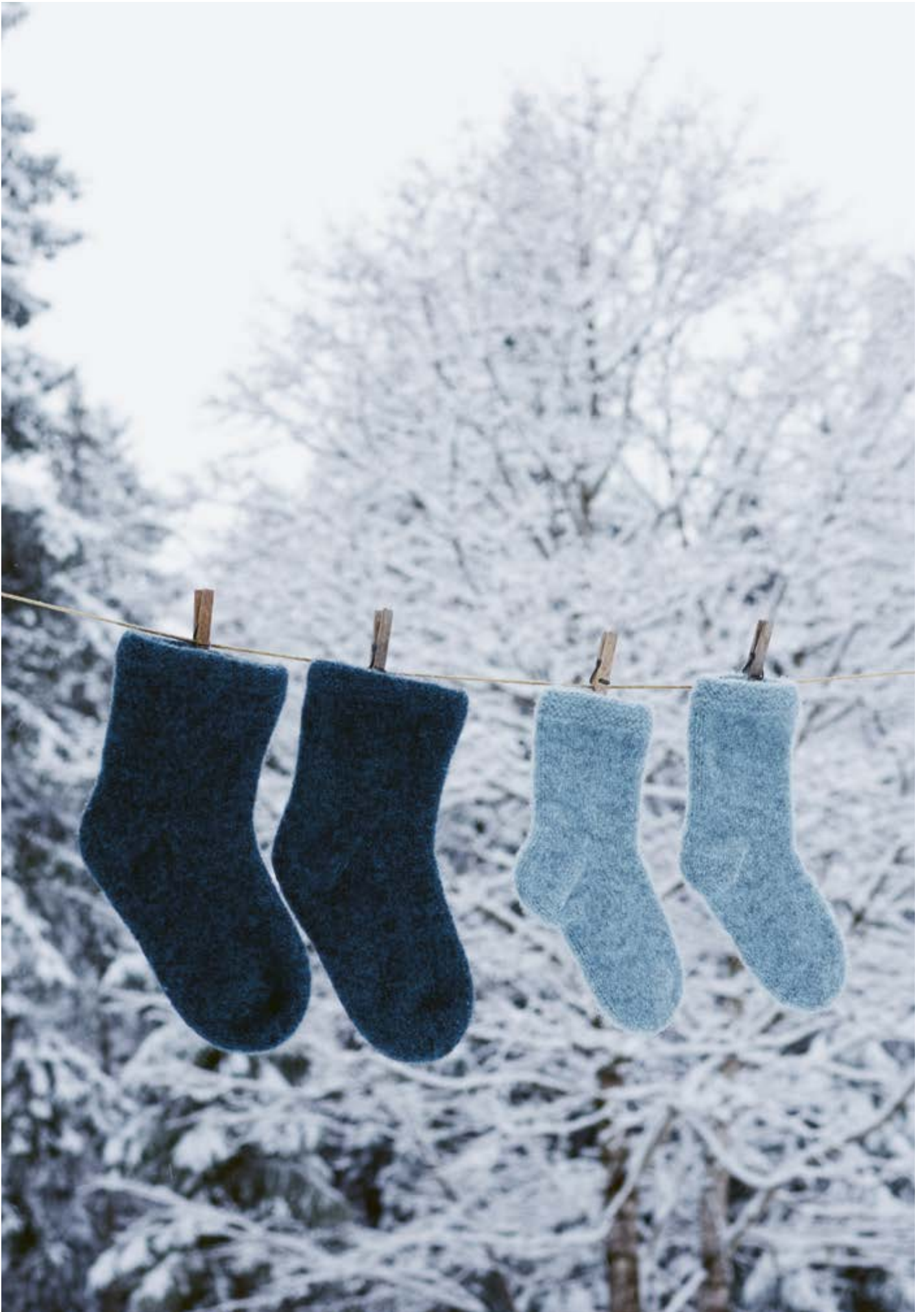
289-2 Tova sokker i Vams 3 - 14 år - dame - herre